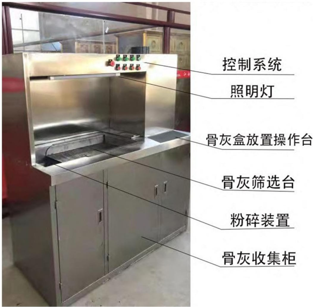
采购包二 鼓风机及支架维修配件材料